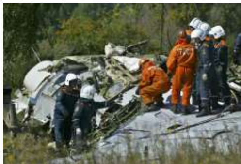
Самолет, взорванный террористами.

В современном мире, к сожалению, много страданий – болезни, преступления, экономические кризисы и войны. Когда умирает больной человек – родственники и друзья оплакивают его, когда погибает солдат с оружием – родина скорбит о нем. Но такая возможность предполагалась, ведь не все болезни мы можем лечить, а солдат, пожарный, милиционер – опасные профессии. Это печально, но соответствует тому, как люди воспринимают этот мир. Но, когда ночью по чьей-то злой воле взрывается жилой дом и погибают спящие в нем люди - рушиться справедливость мира.