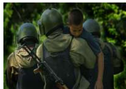
Бойцы спецназа освободили ребенка из рук террористов.