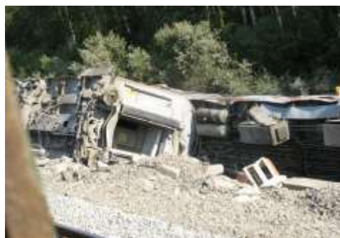
Результаты теракта на железной дороге.

Террористы часто используют оружие и взрывчатку, но это не война. Во время даже самых жестоких войн солдаты стараются не повреждать школы, больницы, религиозные здания и жилые дома. Так как на этот счет существуют жесткие правила ведения войны. Если солдат стреляет по мирным жителям, то такой солдат подлежит строгому суду и жестокому наказанию. Иначе обстоит дело у террористов. Совершая преступления, террористы выбирают такие безопасные для себя места, как больницы, школы, театры, концертные площадки, рынки. Чем больше среди людей,