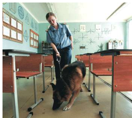
Кинолог с собакой обследует помещения школы.

➤ Каждый случай ложной тревоги тревожит мирных людей, беспокоит, мешает нормально жить. Опасаясь угрозы, эвакуируют школьников, студентов, работников предприятий, жителей домов. Перекрывают дороги, останавливают транспорт. Задерживают отправление