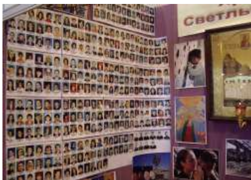
Фотографии детей и взрослых, которых террористы захватили в заложники в школе г. Беслан, а потом убили.

Прежде всего, к терроризму приходят люди с «суженным» сознанием. Они ясно, четко воспринимают, представляют одну мысль, идею. Эта может быть религиозная идея или идея мести. Все остальное в окружающем