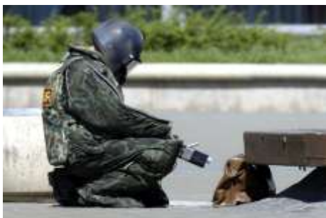
Сотрудник милиции в защитной экипировке специальной аппаратурой и исследует обнаруженный предмет.

Есть несколько практических советов, которые стоит запомнить и стараться соблюдать. Прежде всего, это касается обнаружения подозрительных предметов, которые могут оказаться взрывными устройствами. Подобные предметы обнаруживают в транспорте, на лестничных площадках, около дверей квартир, в учреждениях и общественных местах. Подросток, в силу наблюдательности, большого времени, которое он проводит на улице, в силу природной любопытности и тяги к