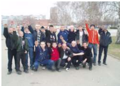
Группа подростков-скинхедов использует нацистское приветствие.

Свойственная этому возрасту идеализация, желание изменить мир, вера в свои силы и лучшее будущее, приводит к завышенности оценок и притязаний, мешает правильно оценить действительность, порождая пессимизм и апатию. Социальная активность подростка часто принимает форму абстрактной социальной критики, он фиксирует свое внимание на том, что его не удовлетворяет, что не соответствует его идеалу. Примером может служить резкость и безапелляционность критических суждений о ситуации в стране, в республике, в городе или поселке, в школе. Это состояние стараются использовать различного рода политические и религиозные течения, пытаясь внушить подростку, что все недостатки, которые он видит, могут быть устранены путем радикальных действий.