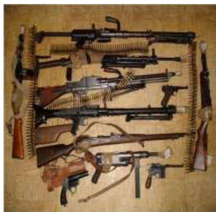
Оружие, изъятое у бандитов.

Некоторые бизнесмены готовы дать деньги террористам, чтобы устранить конкуренцию со стороны отдельных стран и областей. Например, террористический акт в курортном районе может привести к тому, что люди поедут отдыхать не туда, а в другую страну, которая и получит дополнительную прибыль. Или строители откажутся строить газопровод из-за угрозы терактов в одной стране и будут прокладывать его в соседнем регионе.