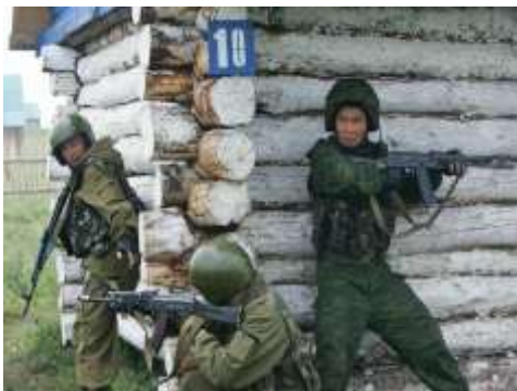
Бойцы группы антитеррора проводят учения по поиску и задержанию террористов.

Это позволяло террористам чувствовать себя безнаказанно и поощряло их к новым террористическим атакам. У современных спецслужб есть возможности не дать террористам уйти, и одновременно обеспечить максимально возможную безопасность заложникам. Большинство терактов последних лет с захватом заложников закончились уничтожением или арестом террористов.