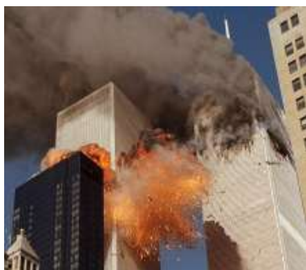
Взрыв террористами небоскребов Всемирного торгового центра в Нью-Йорке 11 сентября 2001 года.

Терроризм – слово, которое сегодня можно часто услышать. Его обсуждают между собой родственники, учителя и просто прохожие. О нем говорят в новостях по телевидению. Террористов показывают в кино и пишут о них в книгах. Взрослых очень волнует эта тема. И, наверняка, они уже говорили вам – что терроризм это большое зло. Только вот объяснить, почему же тогда нельзя взять и уничтожить это зло - непросто. Ученые и политики знают, какое это сложное явление и как тяжело его искоренить. В первой книге для младших классов вы узнали, что такое терроризм, что и зачем делают террористы, как с ними борется государство. Сейчас, когда вы уже больше знаете о мире вокруг нас и лучше разбираетесь в поведении людей, мы возвращаемся к разговору о терроризме. Ведь, для того, чтобы это страшное слово ушло из нашей жизни, надо много сделать, много знать и обладать проницательностью – уметь видеть скрытые причины поведения окружающих.