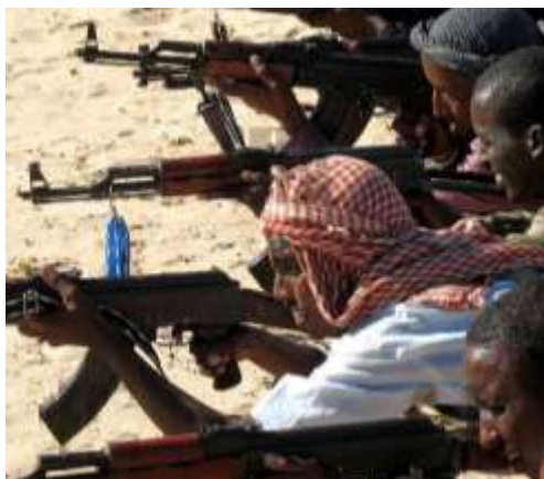
Подготовка в международных лагерях террористов.

слова «борцы за свободу», «бойцы сопротивления», «воины Аллаха», «народные мстители».