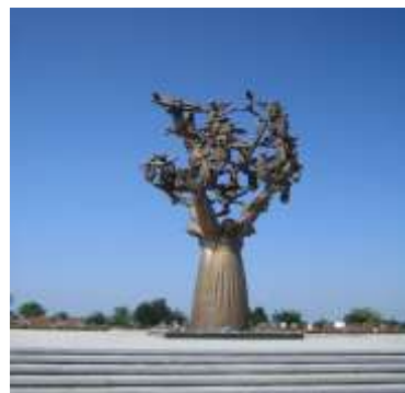
Памятник детям, погибшим во время теракта в г.Беслане.

Когда жизнь людей уносит болезнь – такова судьба или воля Всевышнего. Когда человек гибнет в автокатастрофе, причина – невыполнение правил дорожного движения. Но в случае теракта, причина – воля других людей.