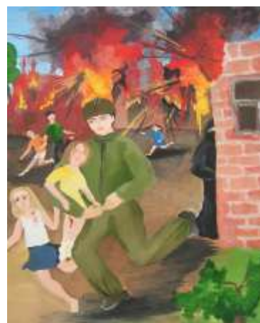
Детский рисунок теракта.