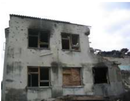
Школа, разрушенная в ходе теракта.

Первая причина, назовем ее объективной, заключается в том, что в мире есть благополучные и неблагополучные страны и регионы. В одних странах развита промышленность, транспорт, много материальных и духовных благ. В других, свирепствуют нищета, голод, болезни. Именно в таких регионах отчаявшиеся люди готовы к любым, даже непродуманным действиям. Главари террористов подсказывают – «виновники те, кто живет хорошо» и снабжают набранных «борцов» оружием и взрывчаткой. Большинство известных в мире террористов – выходцы именно из таких бедных стран и регионов. В благополучной стране возможны лишь одиночные акты психически неуравновешенных людей, но терроризм как явление слабо выражен.