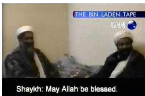
Американский телеканал CNN показывает выступление международного террориста Бен Ладена.

распространения информации и влияния на людей. Из СМИ люди узнают о мире, о мнениях, чувствах и поведении других людей. СМИ, таким образом, способно задавать настроение и определять поведение огромных групп людей. У людей есть потребность в познании окружающего мира и эту важную потребность удовлетворяют СМИ.