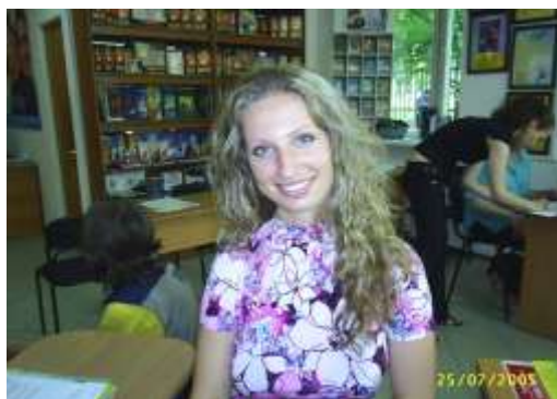
Новичков встречают улыбкой. Фото с сайта одной из религиозных сект «Саентология».

Принцип тоталитарной секты - затянуть человека в свои сети прежде, чем он что-нибудь о ней узнает. Когда же вербовщики затаскивают человека в секту, то их задача как раз обратная — «захлопнуть за ним дверь», пока он ничего еще не знает об их организации. Потому что если рассказать человеку, заполняющему «тест», что на самом деле он на долгие годы попадет в секту, будет днество и ночество в этой секте, что его могут заставить совершать преступления и почти наверняка заставят порвать со всеми родными и близкими, очень мало кто согласится пойти в эту секту.